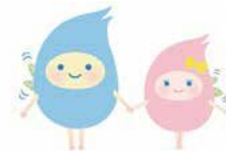
マスコットキャラクター ぽっぽとぴっぴ